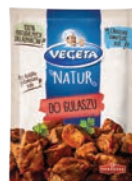
Do gulaszu 20 g