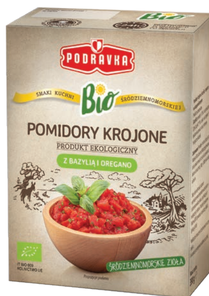
BIO Pomidory krojone z bazylią i oregano 390 g