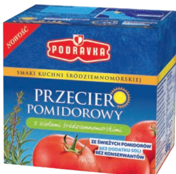
Z ziołami śródziemnomorskimi 500 g