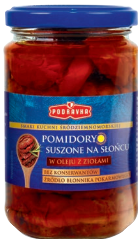
Pomidory suszone w oleju z ziołami 270 g