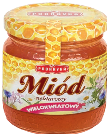
Miód wielokwiatowy 200 g