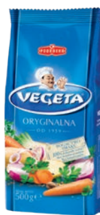
Vegeta 500 g