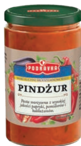
Pindżur 195 g