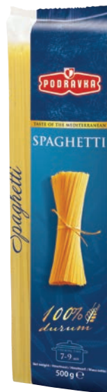
Spaghetti 500 g