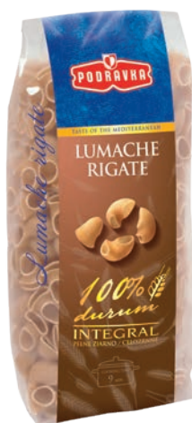
Lumache Rigate 400 g