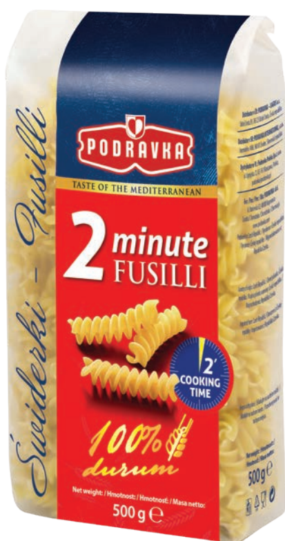
Fusilli 2 min 500 g