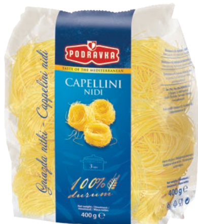
Gniazda nitki 400 g