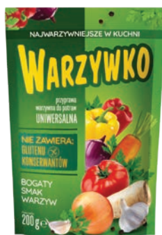
Warzywko 200 g