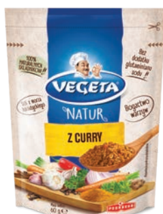
Z Curry 60 g