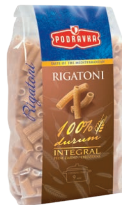
Rigatoni 400 g