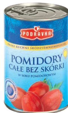
Pomidory całe 400 g