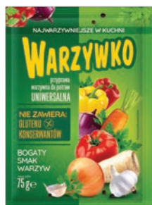
Warzywko 75 g