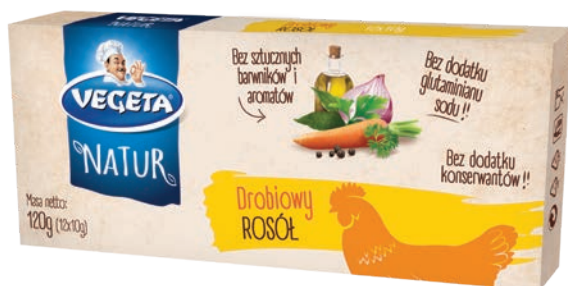
Rosół drobiowy Natur 120 g