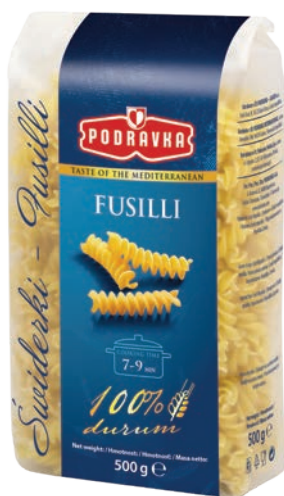
Świderki 500 g