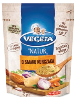
O Smaku Kurczaka 60 g