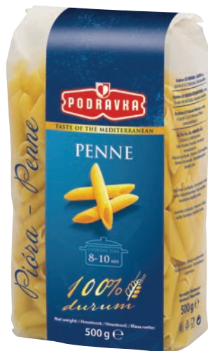
Pióra 500 g