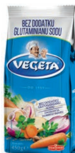
Vegeta 450 g