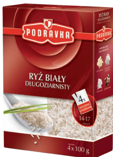
Ryż biały długoziarnisty 4 x 100 g