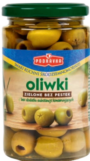
Zielone bez pestek 330 g