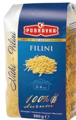
Nitki cięte 500 g