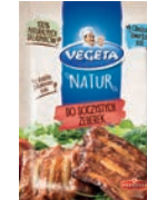
Do soczystych żeberek 20 g