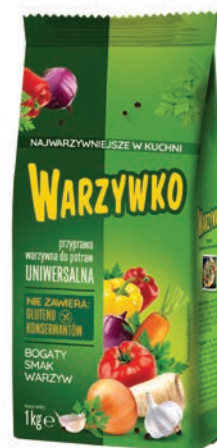
Warzywko 1000 g