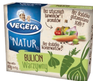
Bulion warzywny 60 g