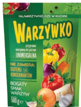
Warzywko 500 g