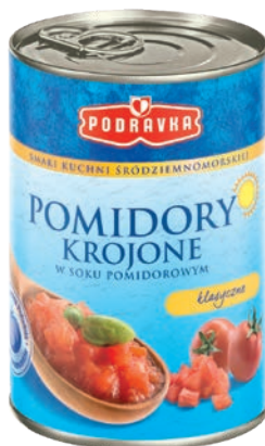
Pomidory krojone 400 g