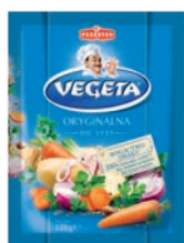
Vegeta 125 g