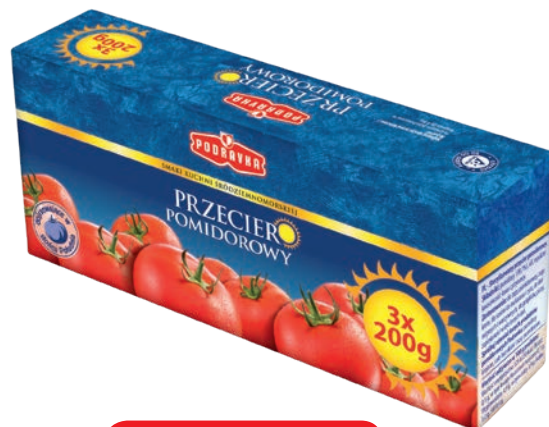
Klasyczny 3 x 200 g