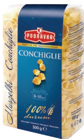
Muszelki 500 g