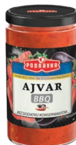
Ajvar BBQ 195 g