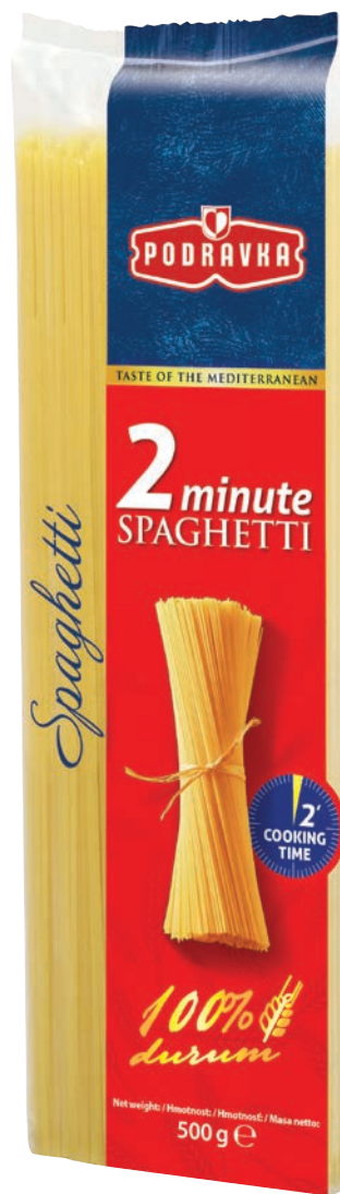
Spaghetti 2 min 500 g