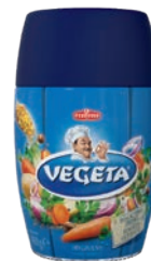
Vegeta 400 g