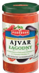
Ajvar łagodny 195 g