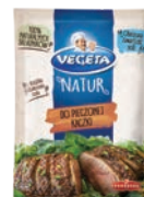
Do pieczonej kaczki 20 g