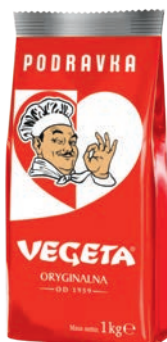
Vegeta 1000 g