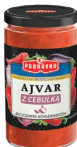
Ajvar z cebulką 195 g