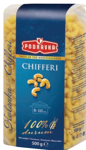
Kolanka 500 g