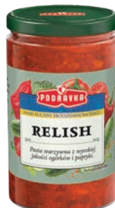
Relish 200 g