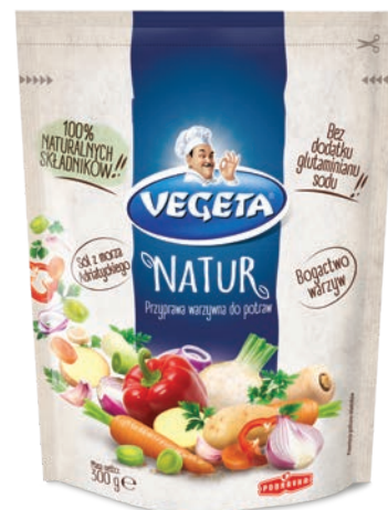
Vegeta Natur 300 g