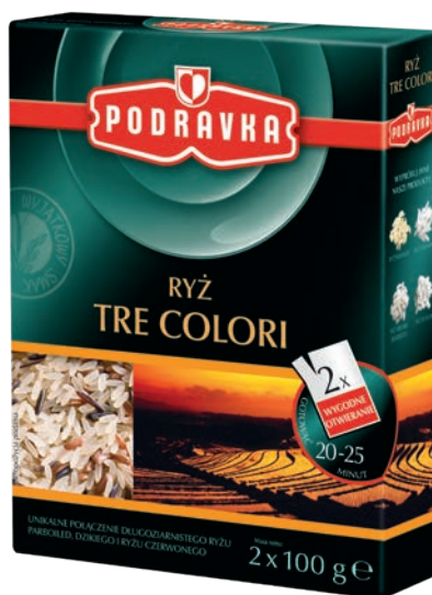
Ryż tre colori 2 x 100 g