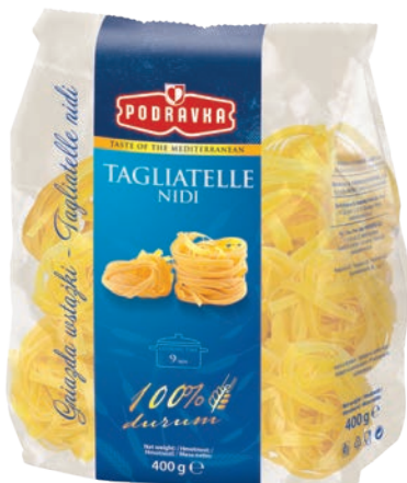
Gniazda wstążki 400 g