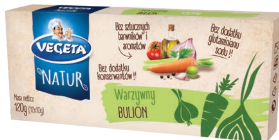
Bulion warzywny Natur 120 g