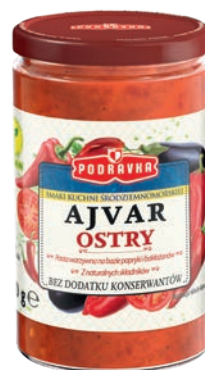
Ajvar ostry 350 g