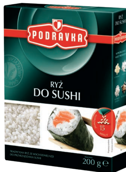
Ryż do sushi 200 g