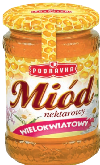
Miód wielokwiatowy 350 g