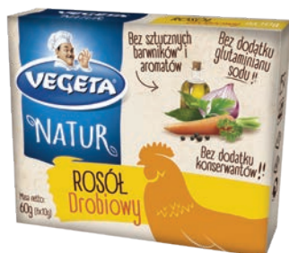
Rosół drobiowy 60 g