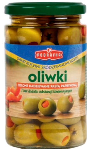
Nadziewane pastą paprykową 350 g