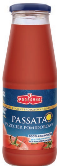
Klasyczny 680 g