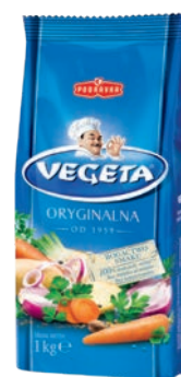
Vegeta 1000 g