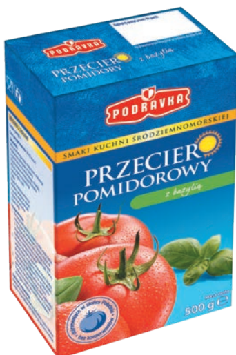
Z bazylią 500 g