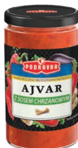
Ajvar z sosem chrzanowym 195 g