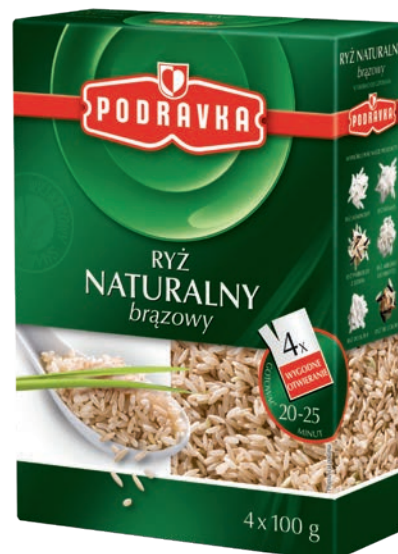
Ryż naturalny brązowy 4 x 100 g