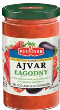
Ajvar łagodny 350 g