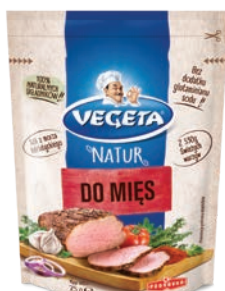
Przyprawa do mięs 75 g