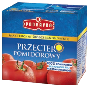
Klasyczny 500 g