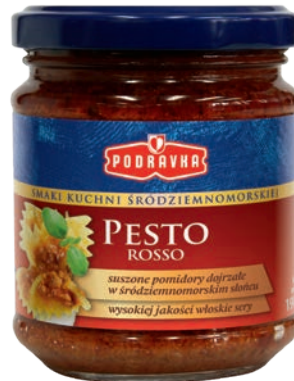
Pesto rosso 190 g