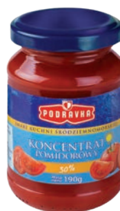
Koncentrat 30% 190 g