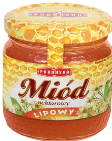
Miód lipowy 200 g