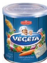
Vegeta 250 g