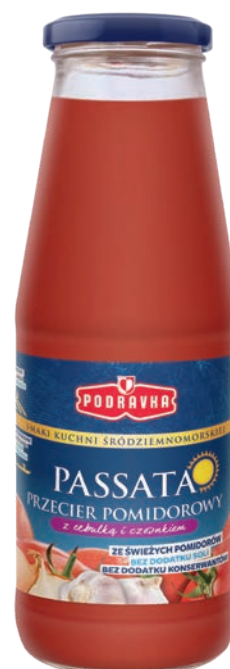
Z cebulką i czosnkiem 680 g