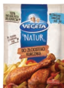
Do złocistego kurczaka 20 g