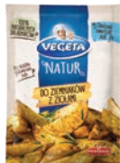
Do ziemniaków z ziołami 20 g