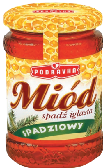
Miód spadziowy 350 g