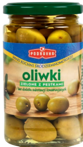
Zielone z pestkami 350 g