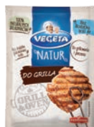
Do grilla 15 g