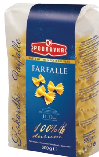
Kokardki 500 g