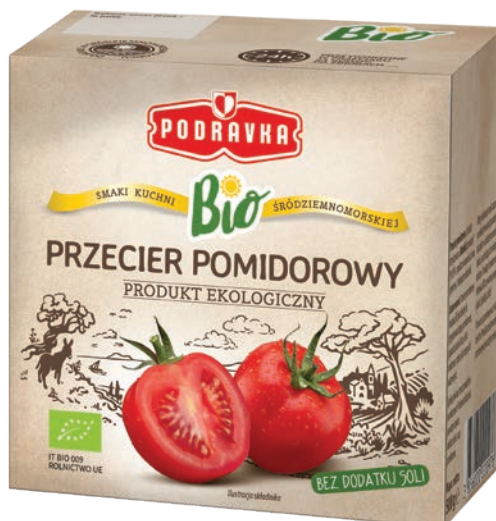
BIO Przecier pomidorowy 500 g