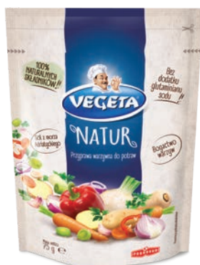
Vegeta Natur 75 g