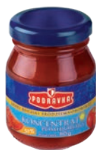
Koncentrat 30% 80 g