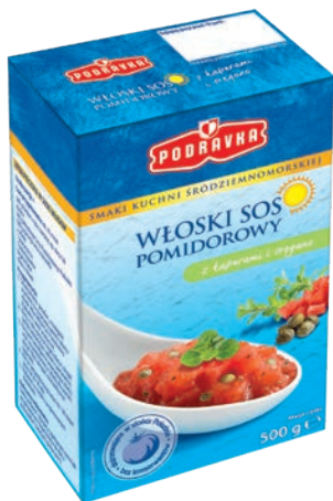
Sos włoski 500 g