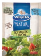
Do sałatek i dipów 20 g