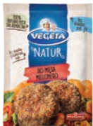
Do mięsa mielonego 15 g