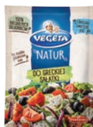
Do greckiej sałatki 20 g