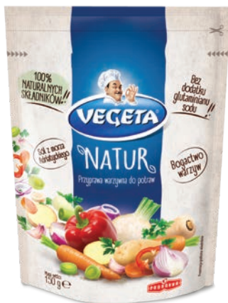
Vegeta Natur 150 g