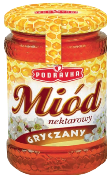
Miód gryczany 350 g