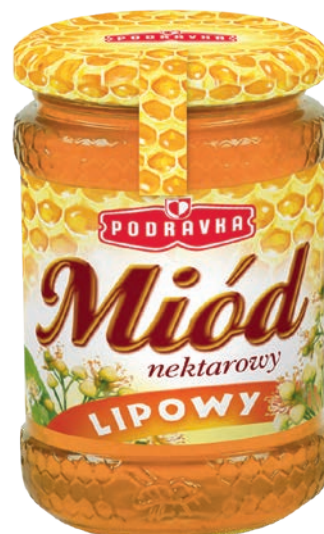
Miód lipowy 350 g