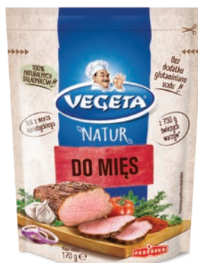
Przyprawa do mięs 170 g