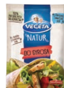
Do gyrosa 20 g