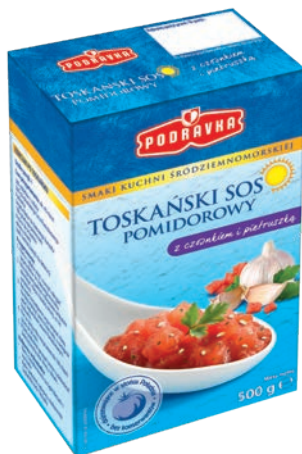
Sos toskański 500 g