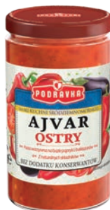
Ajvar ostry 195 g