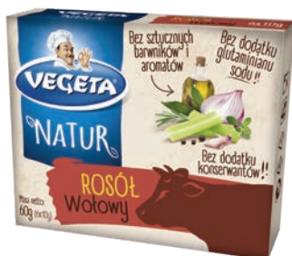
Rosół wołowy 60 g