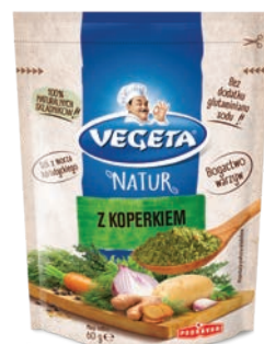
Z Koperkiem 60 g