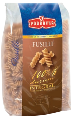
Fusilli 400 g