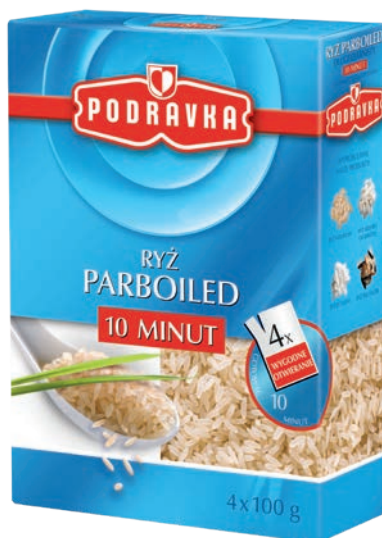
Ryż parboiled 10 minut 4 x 100 g