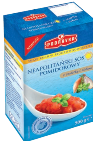
Sos neapolitański 500 g