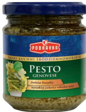
Pesto genovese 190 g