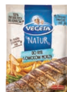
Do ryb i owoców morza 20 g