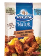
Do pikantnych skrzydełek 20 g