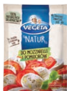
Do mozarelli i pomidorów 20 g