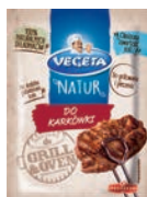
Do karkówki 20 g