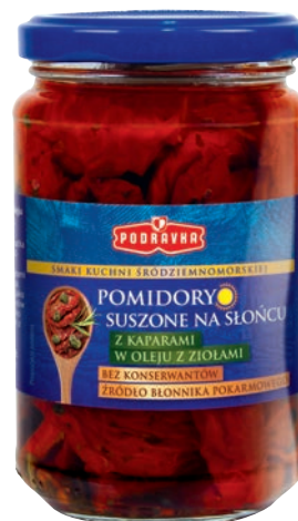
Pomidory suszone z kaparami w oleju z ziołami 270 g