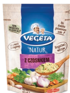
Z Czosnkiem 60 g