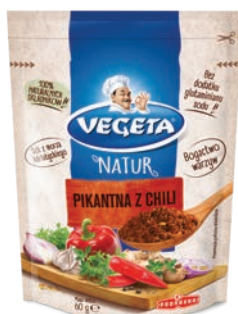
Pikantna z Chili 60 g