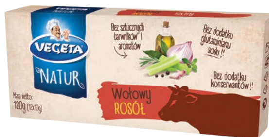
Rosół wołowy Natur 120 g